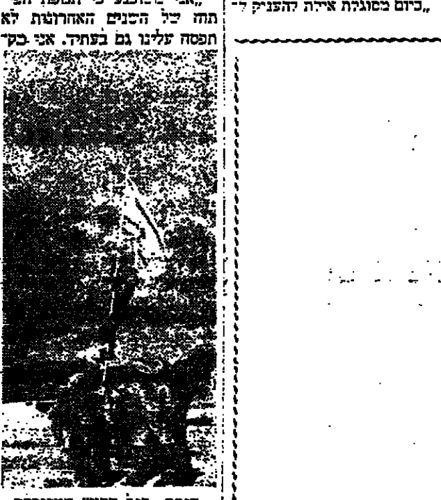
הנמל, סמנטיאציה וים ברזני נמלא קטרים את אילת לקיר היירות פניאציות.

באילת הרגשה כל הייחוס אמת הרגשה כל בעלות כמד התורכים ואמנה בעיר, הרגשה כל בית הפסקו לראות את אילת כשיר כעבר" ותורכה פסקו סוף סוף לרבות על המודח" בניגוד לעבר קיימת נכונה בציבור הרוב בארץ לבוא לראות ולחיות ב" ציר, סום אף היירות ריקות צופי ונת וכפנות לתורכים, להיפך, תורכים צופים בתור וכחכים היירותים רים לים לפה הזכות היירות גדולות יותר, באות יותר ובניה עובדות למעלה מ-1500 חילות דור אילתן ייכנסו התורכים הכבד. כיום כסוגלת אילת להצניק ל-